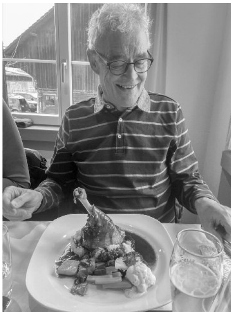
So sieht Vorfreude aus

Der Winter hat auch beim Frauenturnverein Einzug gehalten. Zu den jährlichen Aktivitäten gehört unser vorweihnachtlicher Ausflug in den Europa Park. Unser Car von Merz Carreisen chauffiert uns sicher nach Rust. Pünktlich zur Türöffnung betreten wir gespannt das Winter-Wunderland. Bei sonnigem Wetter tagsüber und tausenden von Lichtern beim Eindunkeln besuchen wir Attraktion um Attraktion. Mit rasanten Fahrten und Glühwein geht der Tag viel zu schnell vorbei.