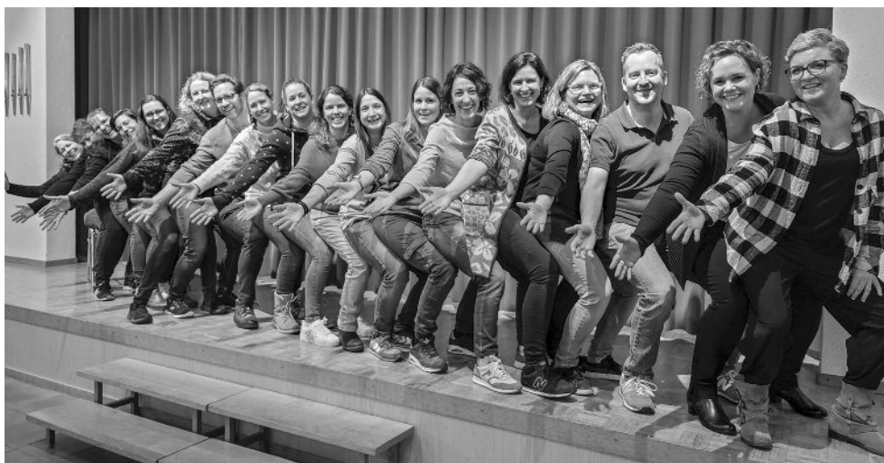
Das Team vom Ferienspass Homberg 2025

VIELEN DANK für 24 wunderschöne «Türchen» in unserem Dorf-Adventskalender, die von Birrwilerinnen und Birrwilern privat oder im Verein liebevoll gestaltet wurden und die Möglichkeit für schöne und interessante Begegnungen boten. Übrigens: Wer es nicht geschafft hat, die vorweihnachtlich geschmückten Fenster oder Gärten live zu erleben, der kann auf www.verkehrsverein-birrwil.ch auch jetzt noch die «Türchen» bestaunen. Natürlich ist der Dorf-Adventskalender immer etwas Besonderes. Aber wir wollen nicht vergessen, dass auch an anderen Anlässen im 2024 wieder viele helfende Hände dabei waren.