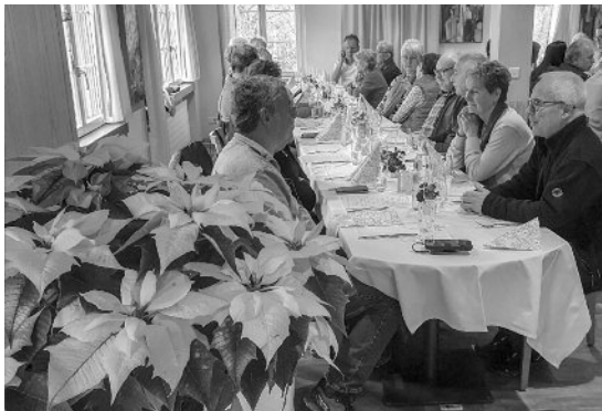
Angenehme Stimmung in der Alpwirtschaft Horben

Alles in allem ein durchaus gelungener Anlass, der einige der Teilnehmer zudem wieder auf den neuesten Stand des Geschehens brachte - in der Welt, in der Schweiz und sogar in Birrwil.