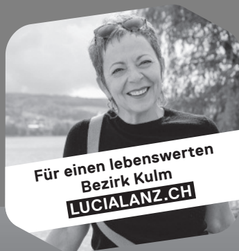
Grossratskandidatin SP Bezirk Kulm | Liste 2