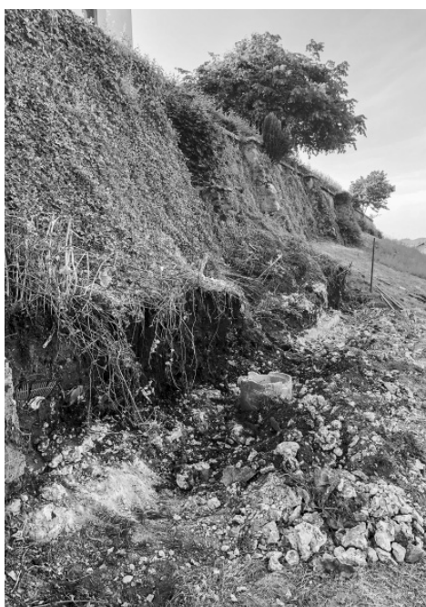
Abbruch der Mauer.

Durch den Rückbau sind einige Gärtnerutensilien wie «Häckeli oder Rechen» zum Vorschein gekommen. Wenn diese Gegenstände sprechen könnten, wüssten sie sicherlich einige Geschichten zu erzählen.