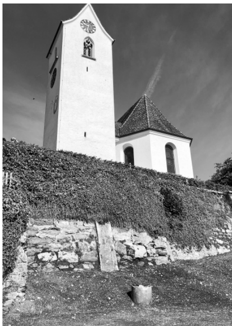
Die neue Mauer sieht schön aus.

Nun erscheint die Steinmauer wieder in alter Frische.