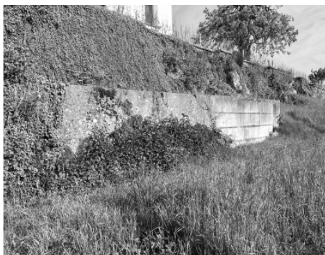
Die Mauer vor der Instandsetzung.