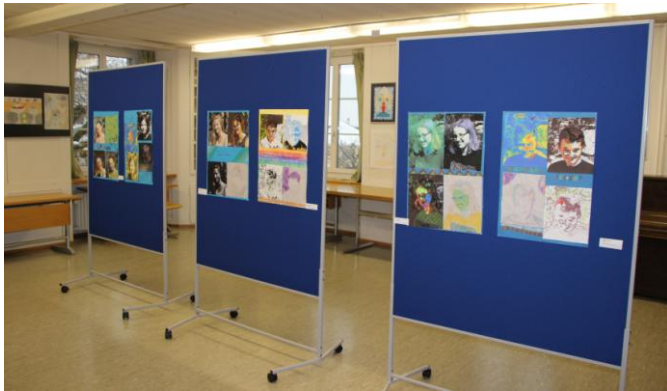
Schulhaus und Schulzimmer werden zu einem Kunsthaus umgestaltet.