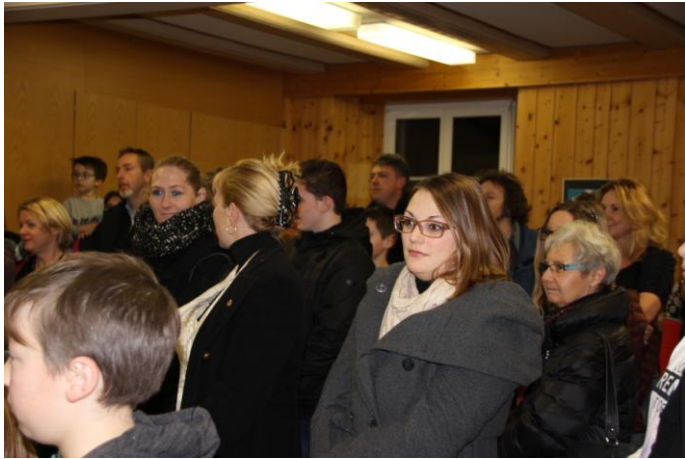
Volles Haus bei der Vernissage im Schulhaus.